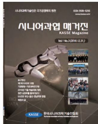
제1권 제3호(2016년 12월)